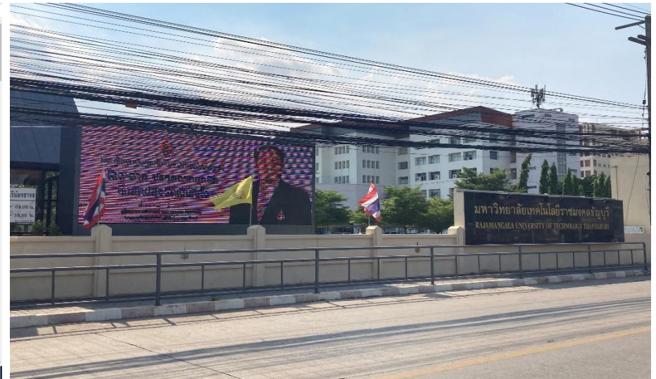
เผยแพร่ทางจอ LED ของมหาวิทยาลัย